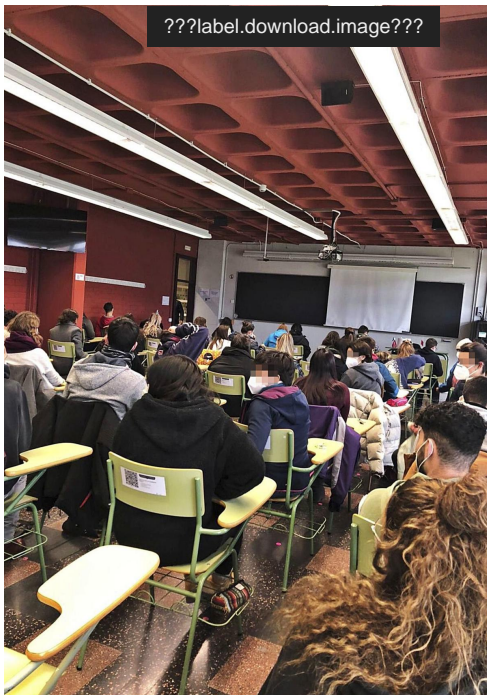
Alumnes de la facultat de ciències de la Universitat de Girona fent un examen.