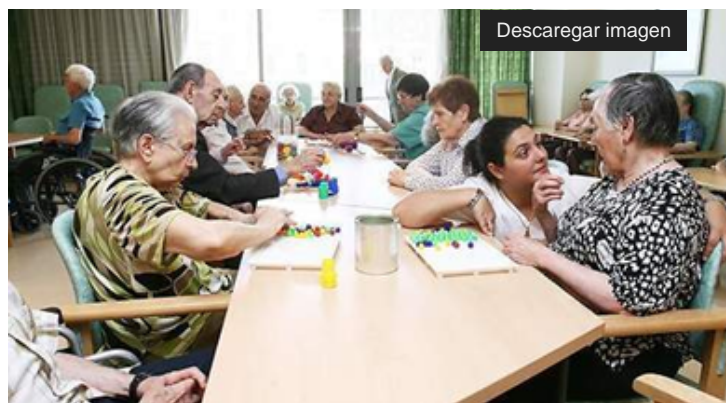
Ejemplo de residencia de ancianos

En las 5.457 residencias españolas, ha sido imposible hasta el momento saber cuántas víctimas mortales ha dejado el virus del Covid-19 . Si podemos afirmar que Cataluña registra hasta el momento cerca de 2.000 muertes en residencias, siendo el segmento de la población más afectado por el coronavirus, detallados ayer por la consejera de salud, Alba Vergés. Por otra parte, los ancianos fallecidos en España equivaldrían al 66% del total según ha informado el Ministerio de Sanidad.