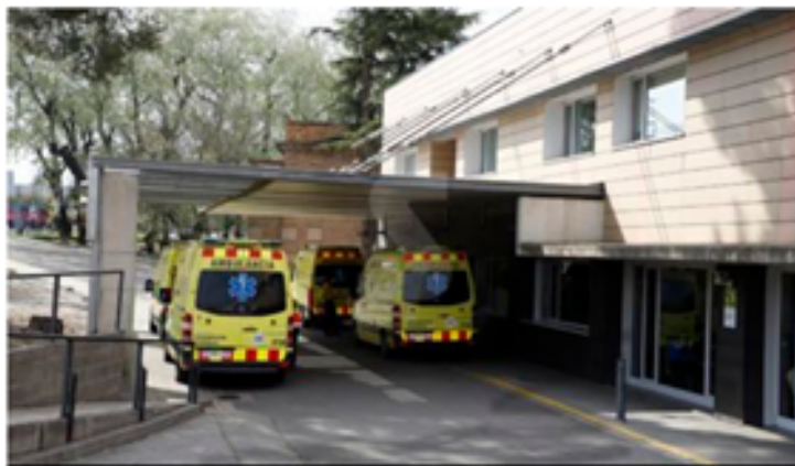
Ambulancias en la entrada de urgencias del hospital Arnau de Vilanova de Lleida

Las víctimas superan las 200 desde el inicio de la pandemia || Otros 22 nuevos casos positivos y 26 altas hospitalarias