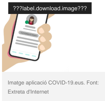
Imatge aplicació COVID-19.eus.

https://canalsalut.gencat.cat/ca/salut-a-z/c/coronavirus-2019-ncov/stop-covid19-cat/ https://canalsalut.gencat.cat/ca/salut-a-z/c/coronavirus-2019-ncov/stop-covid19-cat/ ]. En el cas d'aquesta aplicació, només et demanen la teva informació sanitària (número de la targeta sanitària), i després també et realitzen un test, el qual avalua els símptomes que pateixes i si és necessari realitza un seguiment del teu cas. A més a més manté informats als seus usuaris sobre l'evolució de la pandèmia a la Comunitat.