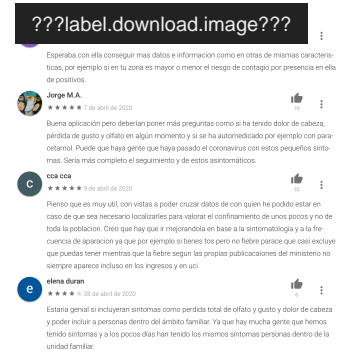
Opinions dels usuaris de l'aplicació 'Asistencia COVID-19'.

personal (número de telèfon, nom, cognom, etc.), per després fer un seguit de preguntes per determinar quins símptomes tens i donar-te un seguit de consells que s'adequaran a la teva situació.