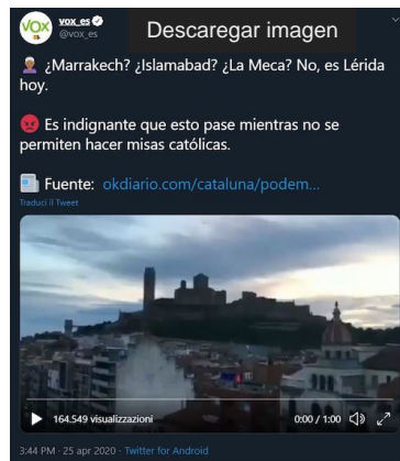
El polèmic tweet de VOX.