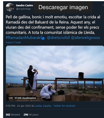
El polèmic tweet de VOX.

el vist bo de la Paeria. Però no acaba aquí, el tweet va tenir un total de 900 respostes on la majoria criticaven d'incoherent a Castro, per defensar una tradició i religió, clarament, masclista i homòfoba. Sembla que els occidentals partim d'una religió cristiana força tolerant en aquests aspectes.