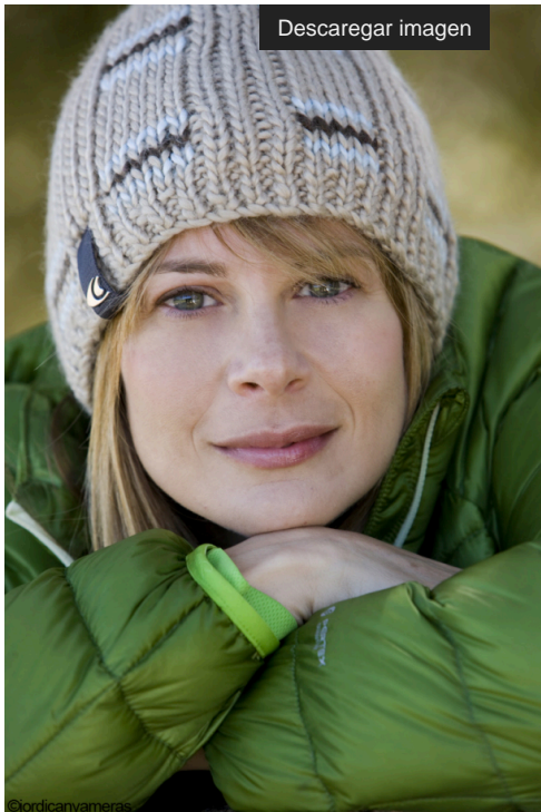
Sessió fotogràfica a l'Araceli Segarra.

Alpinista, il·lustradora, escriptora, conferenciant, comunicadora, model i fisioterapeuta són només algunes de les feines de l'Araceli Segarra, qui, a més, l'any 1996 es va coronar amb l'arribada al cim més alt del món.